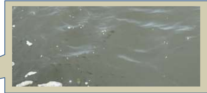
河川に生息する魚の群れ